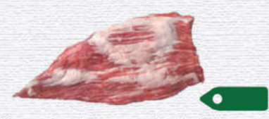
Secreto de papada ibérico

Peso: 1,3 kg/ud aprox. Formato: Caja x ud (10 kg) Código: 016375