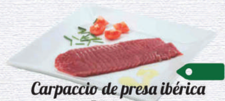
Carpaccio de presa ibérica

Peso: 1,3 gr/ud aprox. Formato: Caja x ud (10 kg) Código: 016384